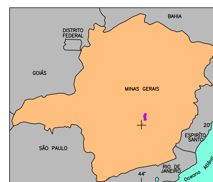
LOCALIZAÇÃO DO PROJETO