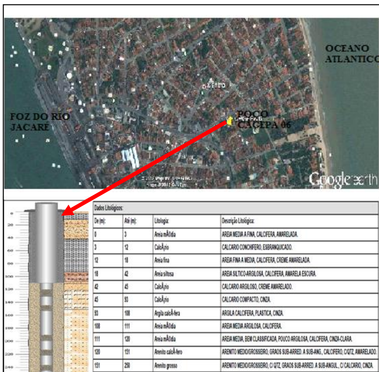
Figura 2. Poço CAGEPA 06, cedido à rede RIMAS, monitorado pelo SGB.

O poço CAGEPA 06 localiza-se na praia de Cabedelo – PB, aproximadamente a 450 metros da linha de praia e quase a mesma distancia da foz do rio Jacaré (figura 2). Este poço, de propriedade da CAGEPA – Cia. De Água e Esgoto da Paraíba, foi cedido à RIMAS por meio de um acordo de cooperação técnica firmado entre a CPRM e a CAGEPA.