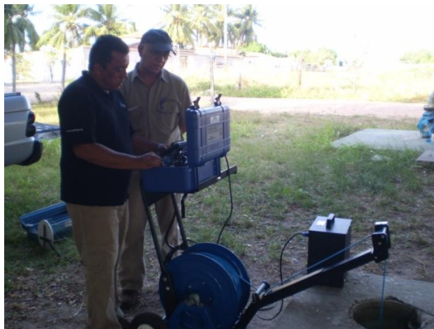
Figura 2. Operação do aparelho