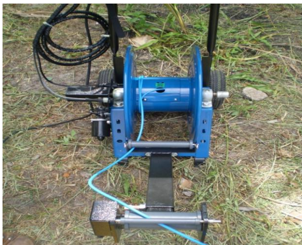
Figura 1. Guincho do Perfilador óptico

Os cabos são ajustados no painel de controle, em que se pluga o motor do guincho, a leitora de DVD, e o cabo de força conectado a uma bateria de 12 V. Existem 02 (duas) câmeras: uma que faz a leitura em profundidade e outra lateralmente perfazendo 360°. Sua técnica de manuseio é relativamente simples, porém não se deve mudar bruscamente a posição das câmeras, pois pode danificar o aparelho. Acompanha-se todo o procedimento através de uma tela, na qual apresenta o a profundidade (ajustar para metro) no canto superior esquerdo, ou em outro visor acoplado no aparelho de gravação de DVD, que vem acompanhando o equipamento.