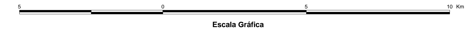
MAPA DE PONTOS D'ÁGUA 2003