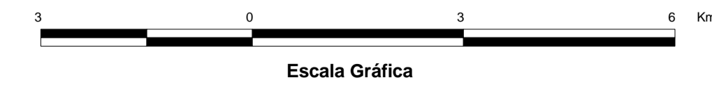
MAPA DE PONTOS D'ÁGUA 2003