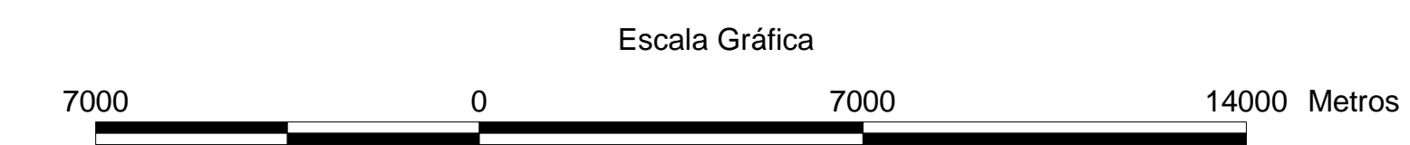
MAPA DE PONTOS D'ÁGUA 2003