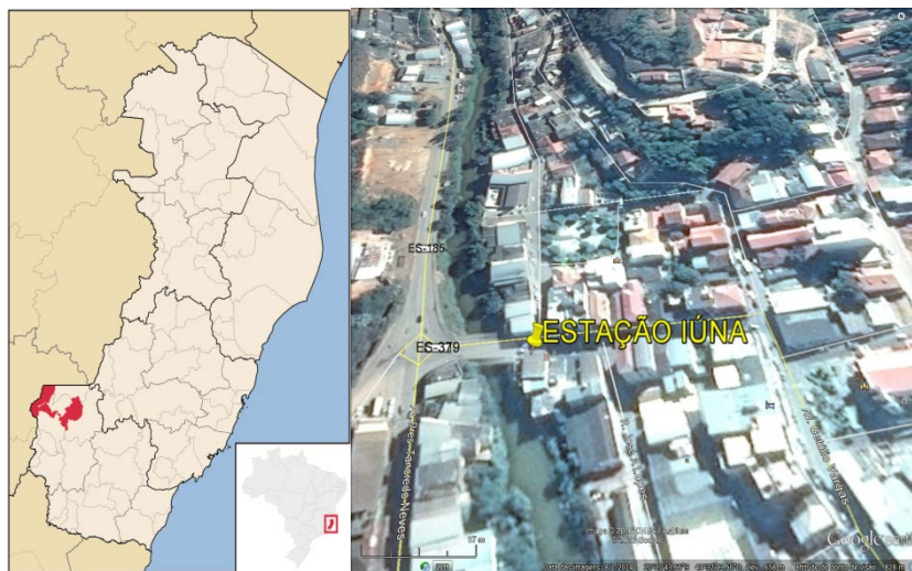
Figura 01 – Localização do Município e da Estação Pluviométrica.

A Estação Iúna, Código ANA 02041013, está localizada na Latitude 20°20'45''S e Longitude 41°32'15''W, dentro do município de Iúna/ES. Essa estação pluviométrica encontra-se em atividade desde 1948, estando atualmente sob a responsabilidade da ANA e operada pela CPRM. A Figura 01 apresenta a localização do município e da estação.