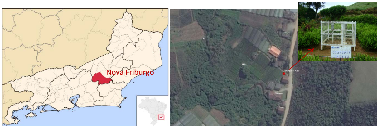
Figura 01 – Localização do Município da Estação Pluviográfica

A estação de Vargem Alta, código 02242019, está localizada na Latitude 22°17'57" S e Longitude 42°24'03" W, acesso pela rodovia que liga Nova Friburgo a Lumiar. Os dados para definição da equação IDF foram obtidos a partir dos pluviogramas de um pluviógrafo IH, modelo 4 (PLG 4). A Figura 01 apresenta a localização do município e da estação.