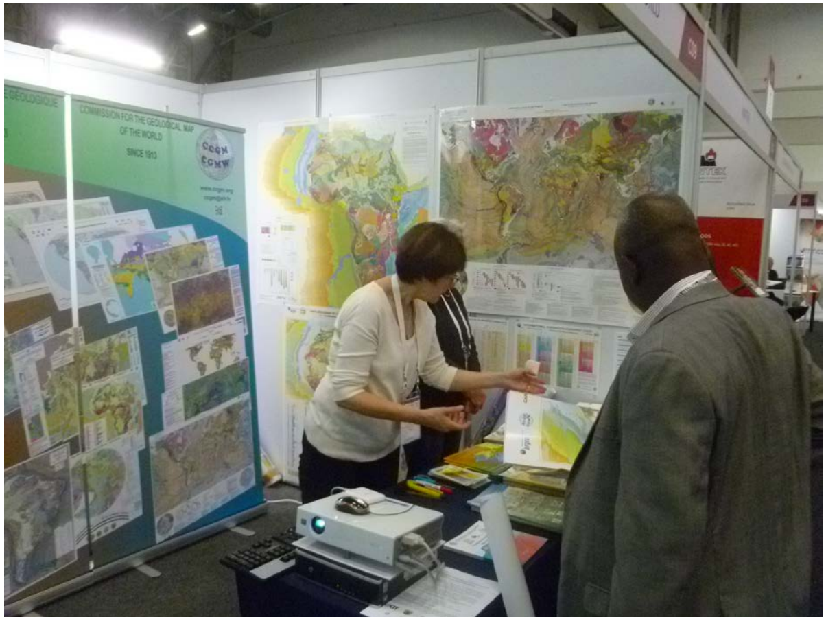
Anexo 1: Estande da Comissão da Carta Geológica do Mundo (CGMW) no 35.IGC