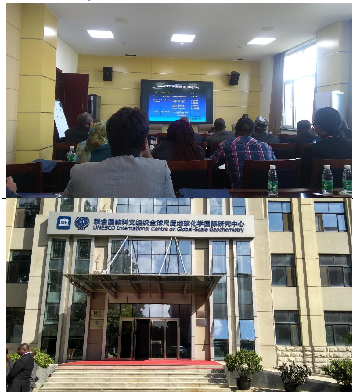
Sala de apresentação de trabalhos e entrada do International Centro on Global-scale Geochemistry, Langfang.