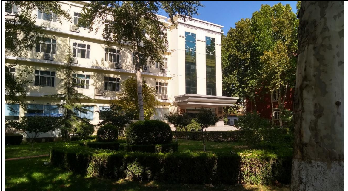
Prédio do laboratório de análises geoquímicas, Langfang.