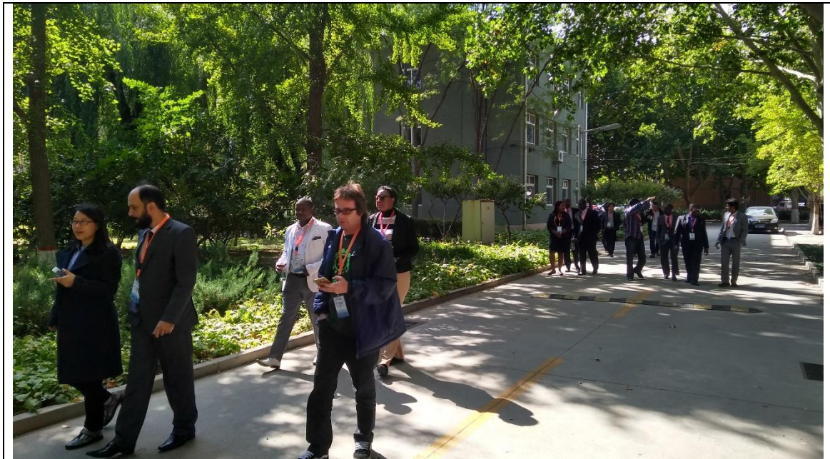
Área externa com espaço arborizado e apartamentos residenciais, inclusive para pesquisadores estrangeiros.