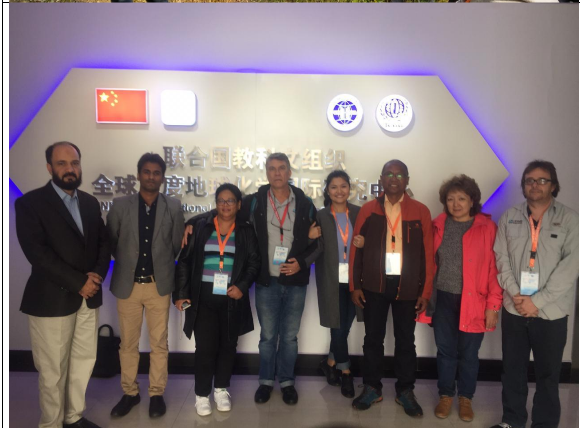
Alguns dos participantes do Workshop e Seminário.