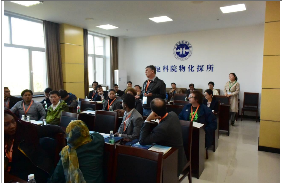
Discussões técnicas durante o 2018 International Workshop on Geochemical Mapping.