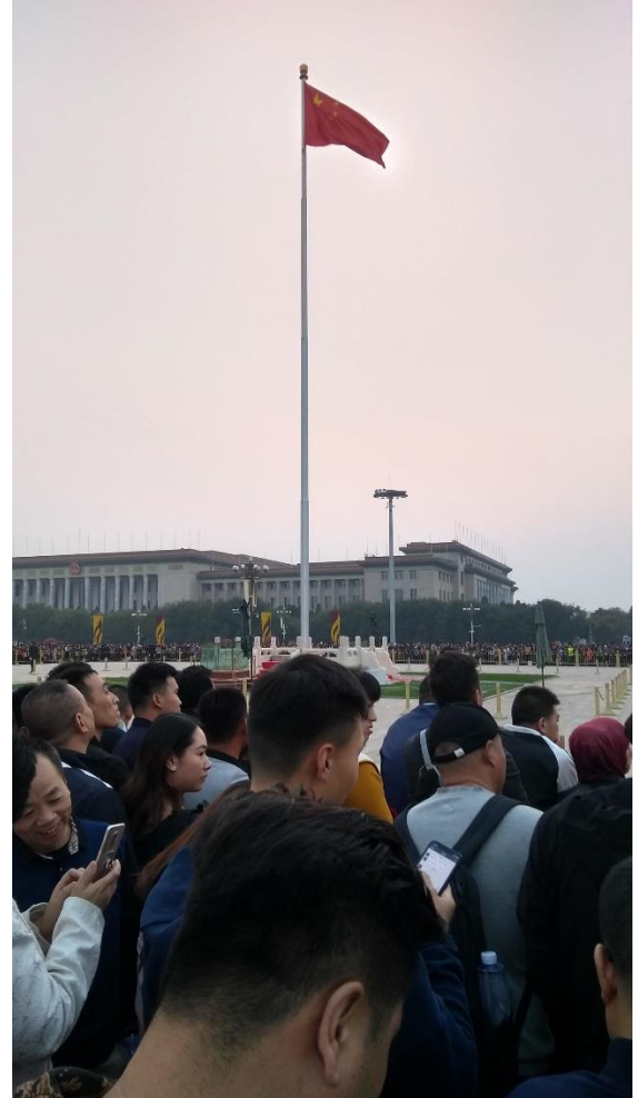
Visita a Beijing: Trem-bala; palácio de verão do imperador, templo , cerimônia da bandeira na praça Tian' anmen.