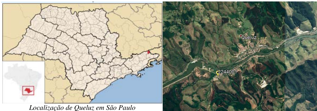
Localização de Queluz em São Paulo

A Figura 01 apresenta a localização do município e da estação.