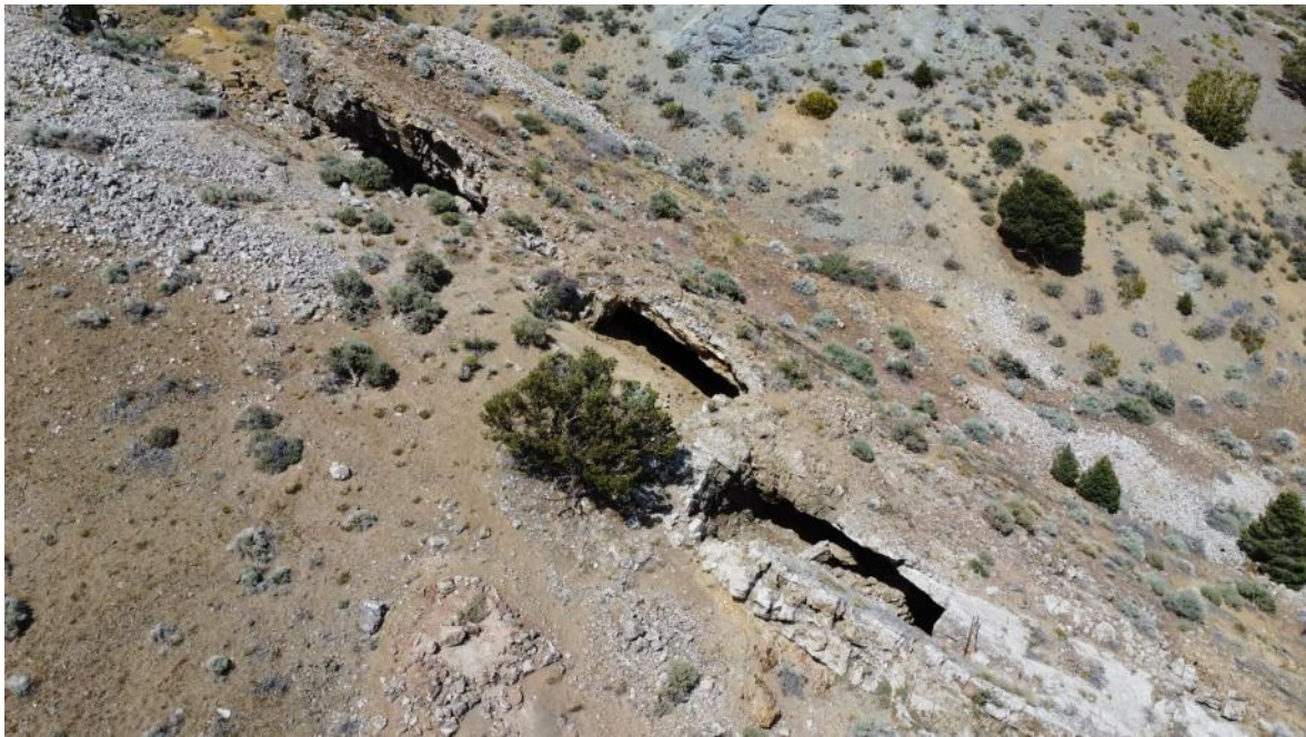
Figura 4: visão aérea das cavas abandonadas em um veio de quartzo mineralizado.