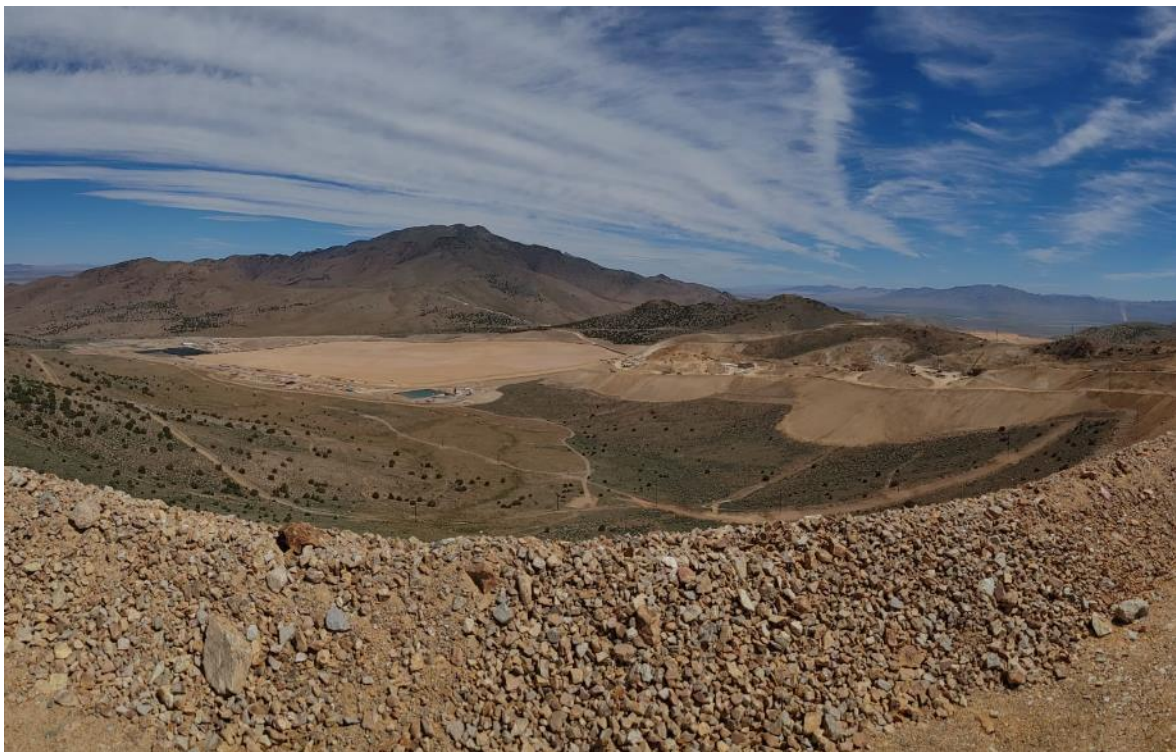
Figura 9: vista parcial da pilha de lixiviação, método utilizado para o beneficiamento do minério após o processo de moagem. Devido à baixa disponibilidade de água potável na região, todo o processo é feito com baixa injeção de fluidos e o mesmo é recuperado ao final do beneficiamento para reutilização.