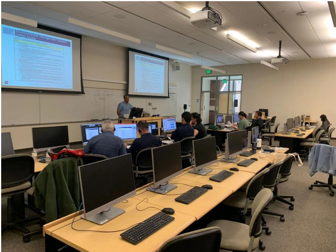
Figura 2: Estrutura de sala de aula no prédio Davidson Mathematics & Science Center