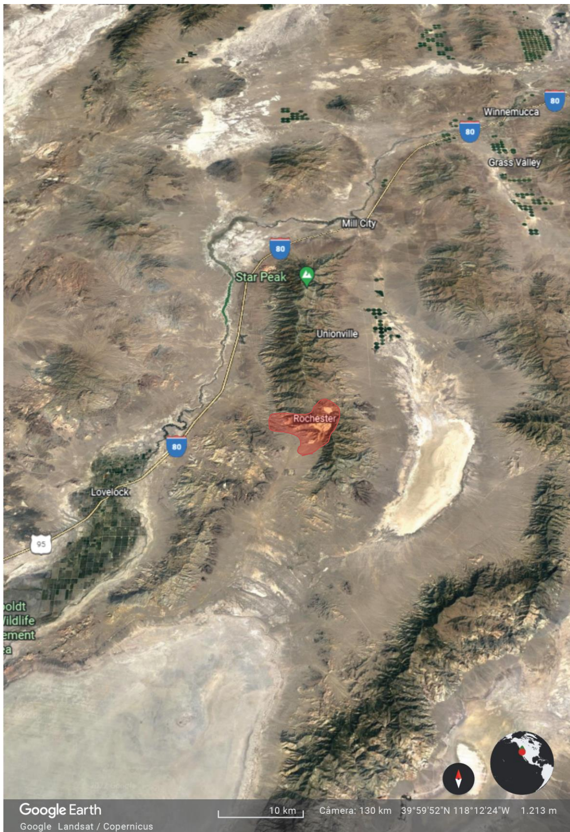
Figura 7: Vista panorâmica da região da mina de Rochester (destacado em vermelho). Alternância entre morros alinhados e depressões caracteriza o relevo da região da “Great Basin”.