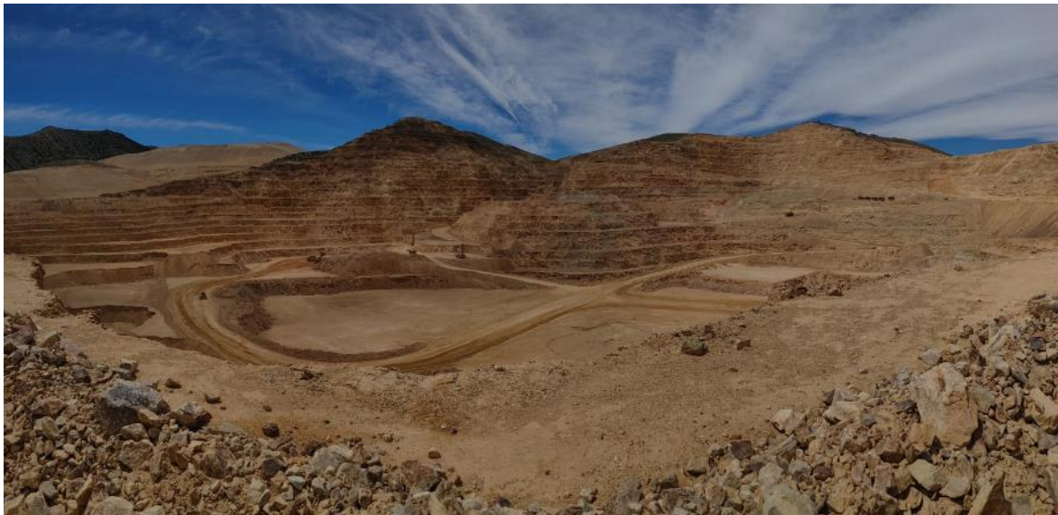
Figura 8: visão parcial da cava ativa da mina Rochester (para referência de escala, a bancada da frente de lavra tem 10 metros de altura).