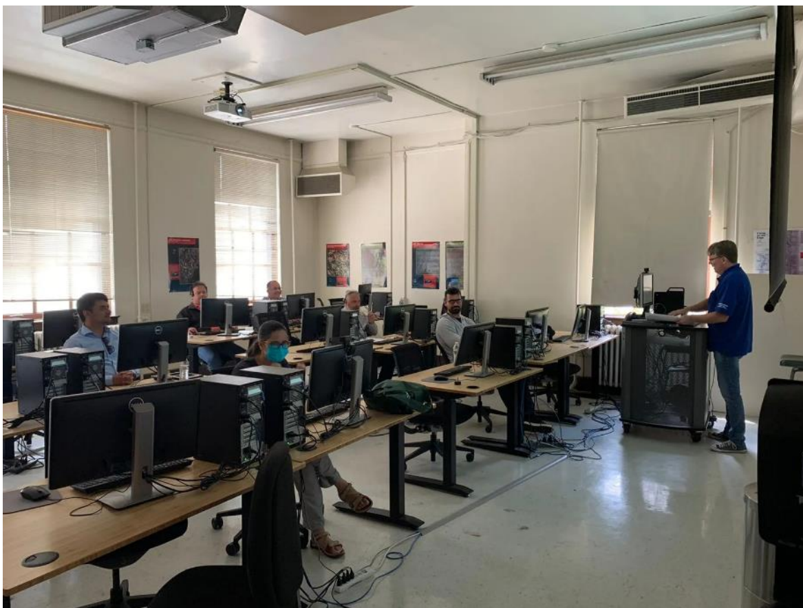
Figura 3: aula prática de SIG no laboratório do Departamento de Geografia da UNR (prédio Mackay Science)