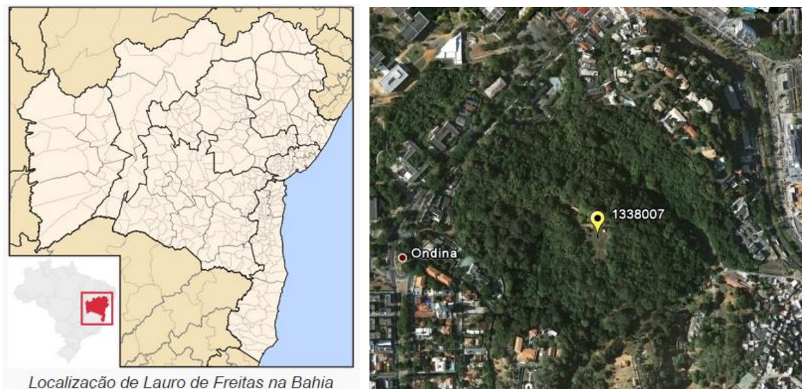
Figura 01 – Localização do Município e da Estação Pluviométrica.

A estação Salvador - Ondina, códigos 01338007 (ANA); 83229 (INMET), está localizada na Latitude 13°01'00"S e Longitude 38°53'00"W. Esta estação pluviométrica continua em atividade, sendo operada pelo Instituto Nacional de Meteorologia (INMET). Os dados para definição da equação IDF foram obtidos a partir dos dados diários de precipitação coletados em pluviômetro convencional. A Figura 01 apresenta a localização do município e da estação pluviométrica.