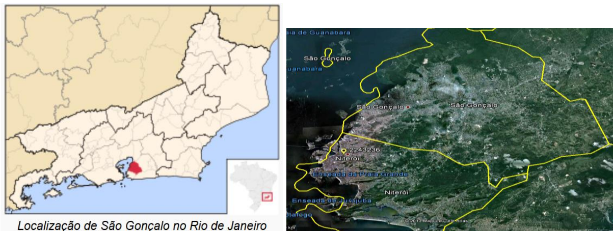
Localização de São Gonçalo no Rio de Janeiro

A Estação Horto Florestal, código 02243236, ficava localizada na Latitude 22°52'58.00"S e Longitude 43°06'27.00"O, no vizinho município de Niterói. Esta estação pluviométrica consta no Inventário Nacional da Agência Nacional de Águas – ANA com Status de “ em operação ”, estando sob a responsabilidade e operação do Instituto Estadual do Ambiente (Inea) – RJ. Os dados para definição da equação IDF foram obtidos a partir dos dados diários de precipitação coletados em pluviômetro modelo Ville de Paris. A Figura 01 apresenta a localização do município e da estação.