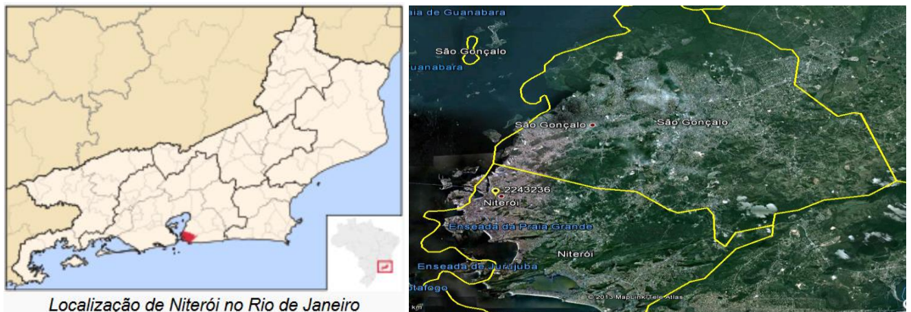
Localização de Niterói no Rio de Janeiro Figura 01 – Localização do Município e da Estação Pluviométrica. (Fontes: Wikipédia e Google, 2013)

A Estação Horto Florestal, código 02243236, ficava localizada na Latitude 22°52'58.00"S e Longitude 43°06'27.00"O, no próprio município de Niterói. Esta estação pluviométrica consta no Inventário Nacional da Agência Nacional de Águas – ANA com Status de “ em operação ”, estando sob a responsabilidade e operação do Instituto Estadual do Ambiente (Inea) – RJ. Os dados para definição da equação IDF foram obtidos a partir dos dados diários de precipitação coletados em pluviômetro modelo Ville de Paris. A Figura 01 apresenta a localização do município e da estação.