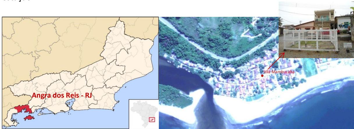
Figura 01 – Localização do Município e da Estação Pluviográfica

A estação de Vila Mambucaba, código 02344016, está localizada na Latitude 23°01'33" S e Longitude 44°31'05" W, acesso pela rodovia BR 101 entre Angra dos Reis e Parati. Os dados para definição da equação IDF foram obtidos a partir dos pluviogramas de um pluviógrafo IH, modelo 4 (PLG 4). A Figura 01 apresenta a localização do município e da estação.