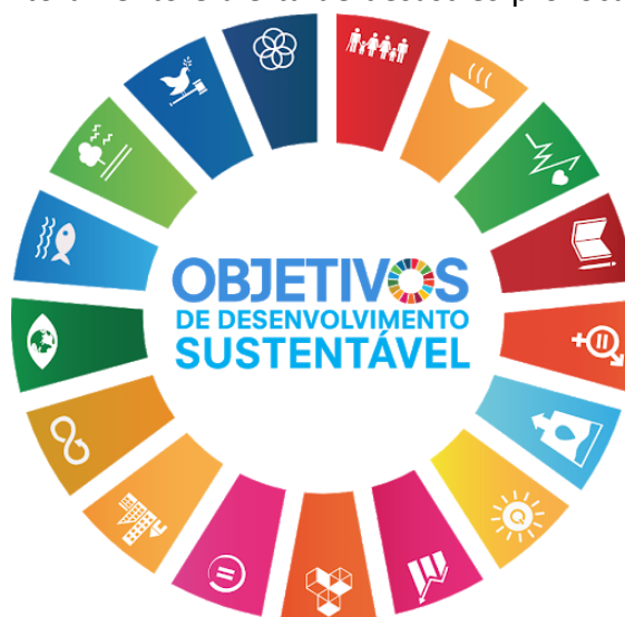
Figura 1 - Objetivos de desenvolvimento sustentável.

Ressalta-se ainda que este estudo está em consonância com os Objetivos do Desenvolvimento Sustentável 2 (Figura 1) e com o marco pós-2015 para a redução de riscos de desastres, também conhecido como Marco de Sendai 3 .