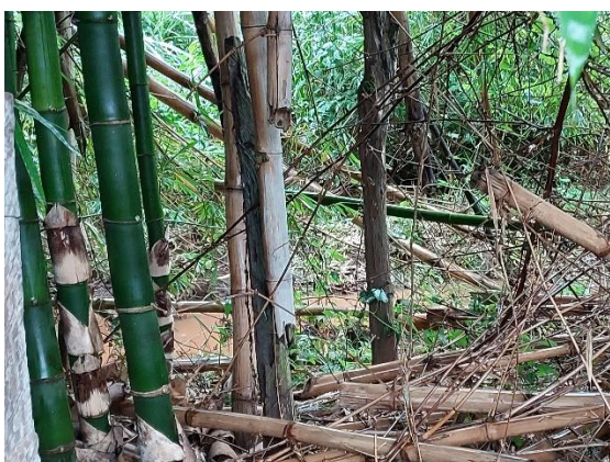
Figura 5 – Afluente do Rio Jacaré-Guaçu.