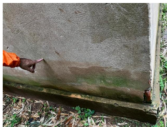
Figura 6 – Marca d'água em residência.