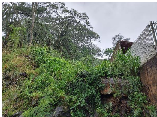
Figura 3 – Residência junto a encosta com blocos de rocha expostos.

Na rua Santo Antônio, distrito de Guarapiranga existem casas construídas próximo a margem de um afluente do Rio Jacaré-Guaçu (Fotos 5 e 6). O Rio atingiu as casas duas vezes uma em 2008 e outra em dezembro de 2022 com lâminas d'água na ordem de 1 metro de profundidade.