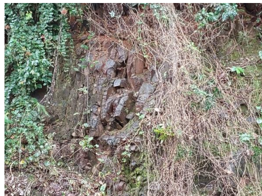
Figura 4 - Exposição de blocos de rocha na encosta.