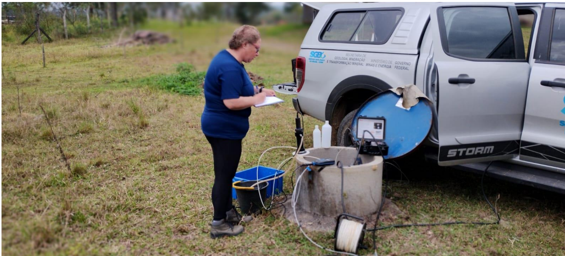
Amostragem com uso do método de baixa vazão sendo realizada.