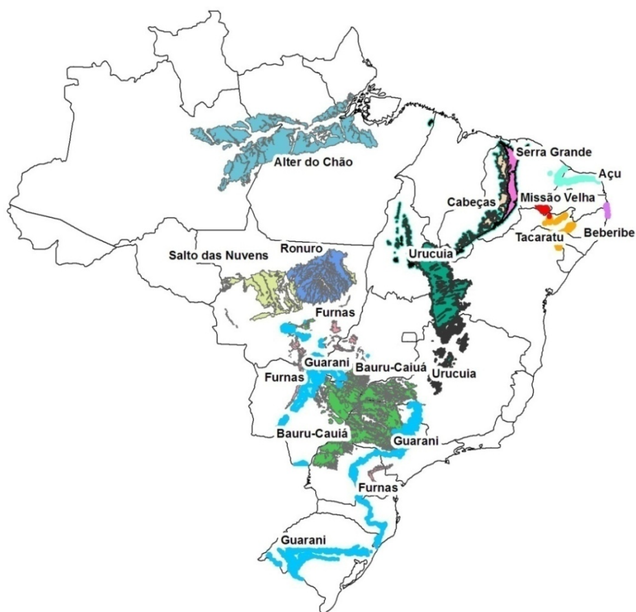
Figura 1. Mapa de áreas de exposição dos aquíferos selecionados na primeira fase do programa de implantação da rede integrada de monitoramento das águas subterrâneas.

Os benefícios de se realizar o monitoramento integrado das águas superficiais e subterrâneas e também de parâmetros climatológicos são os seguintes: