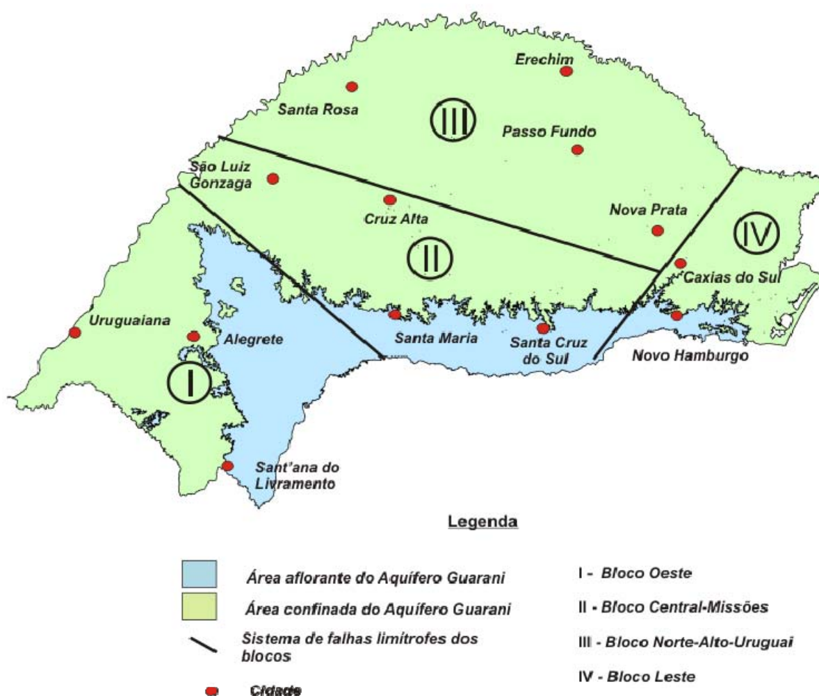
Figura 2. Modo de ocorrência e compartimentação em blocos do Sistema Aquífero Guarani no Rio Grande do Sul, segundo Machado (2005).

O Bloco Central-Missões está separado pelos sistemas de falha Jaguari-Mata, Terra de Areia-Posadas e Dorsal de Canguçu. É composto pelos Subsistemas Aquíferos Santa Maria e Sanga do Cabral-Pirambóia.