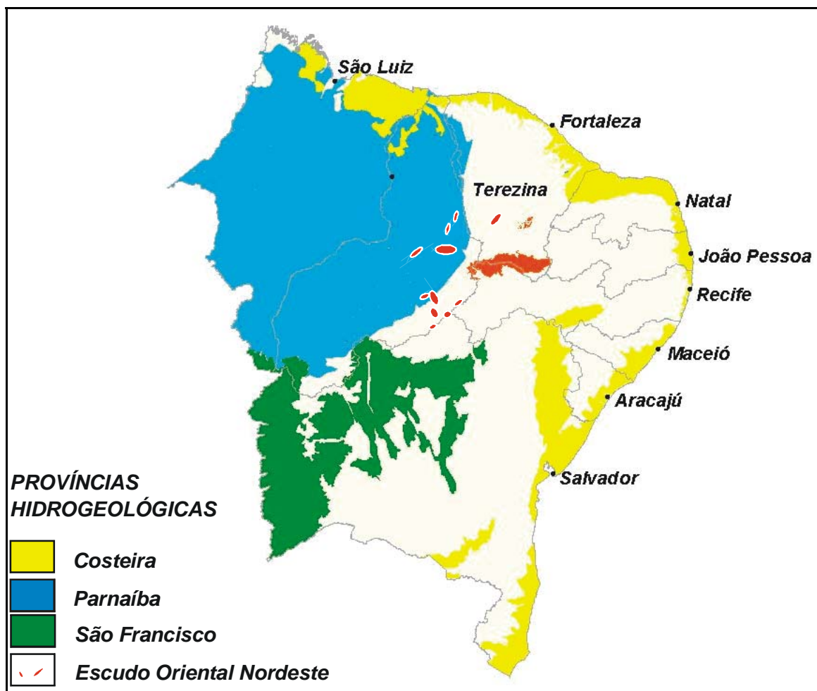
Figura 1 – Províncias Hidrogeológicas do Nordeste